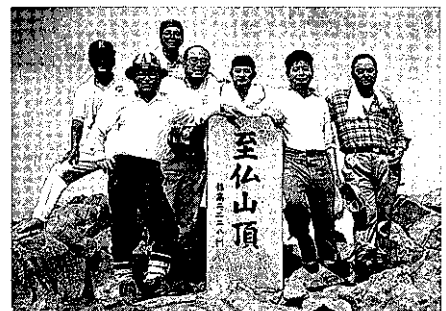
(尾瀬・至仏山頂で)