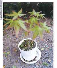
新芽がつかしました。