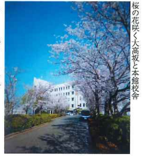
桜の花咲く大高坂と本館校舎

そうだ、本校が昨年度から指定を受けて推進しているSSH事業の目的の中に「自らが問題を発見し…」とある。今の時代、子どもへも大人へも求められるものは同じ、ということか。